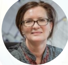
レスター大学 専門職連携教育 E.アンダーソン 教授